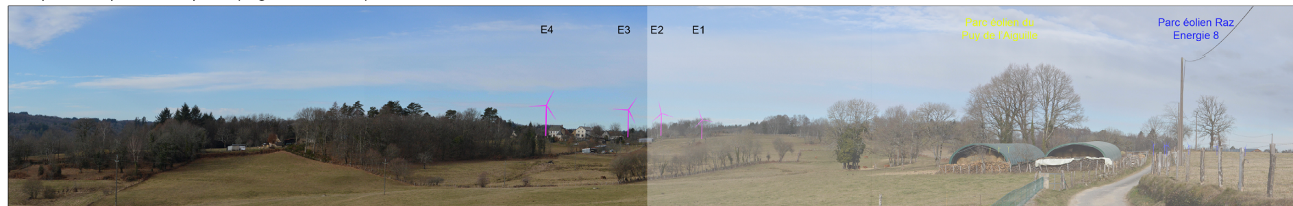
Vue panoramique avec esquisse (angle de vue 120°)