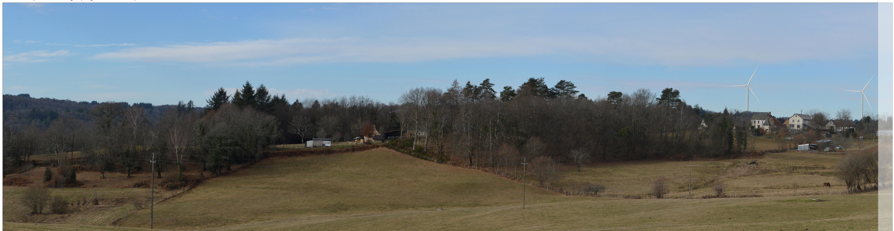
Vue avec photomontage (angle de vue 80°)

Le photomontage doit être observé à une distance de 35cm pour correspondre à une vue réaliste (impression A3).