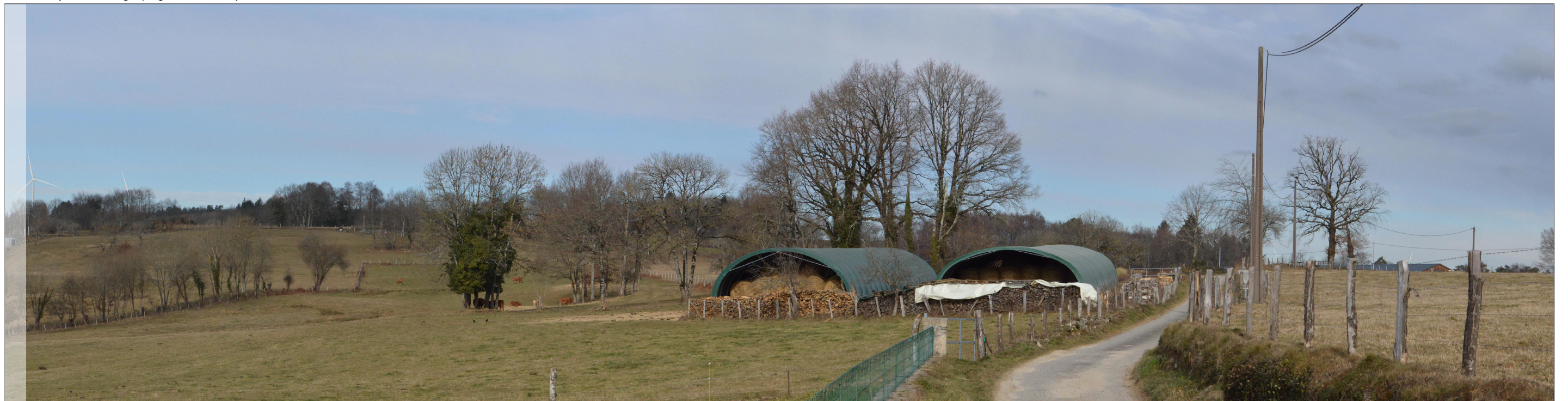
Vue avec photomontage (angle de vue 80°)

Le photomontage doit être observé à une distance de 35cm pour correspondre à une vue réaliste (impression A3).