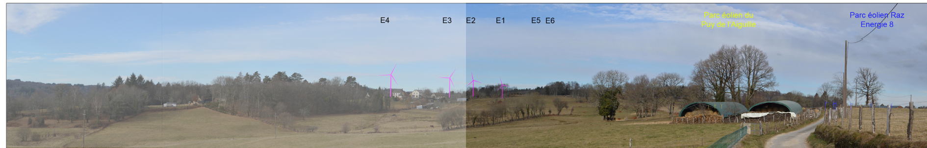
Vue panoramique avec esquisse (angle de vue 120°)